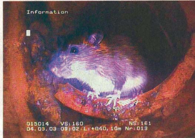
Das Aufspüren von Kanalratten gehört nicht zu den Pflichten von Hauseigentümern, wohl aber die Dichtigkeitsprüfung der Abwasserrohre.

Die Untersuchung durch einen Sachverständigen ist in dem geänderten Landeswassergesetz vorgeschrieben. Die Bestimmung verfolgt das Ziel, dass nicht nur die öffentliche Kanäle in Stand gehalten werden, sondern auch die privaten Anschlüsse. „Defekte und undichte Hausanschlüsse gefährden die Um-